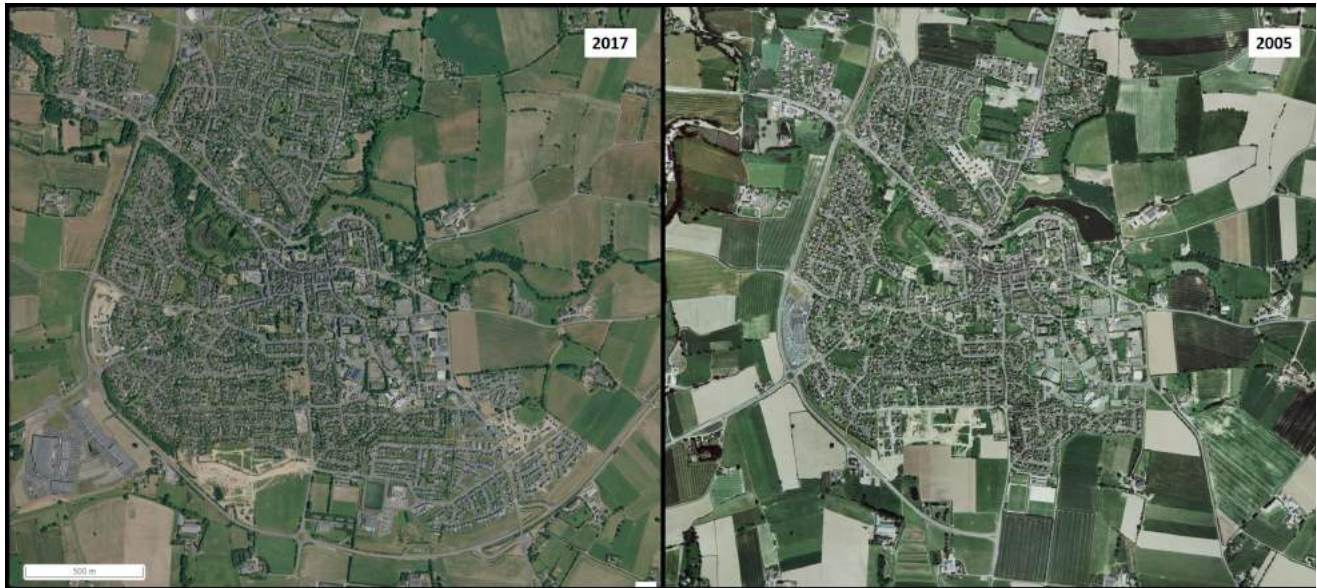
Figure 2 : Illustration de la fragmentation progressive des espaces agricoles par le développement de l'urbanisation et d'infrastructures de transport.