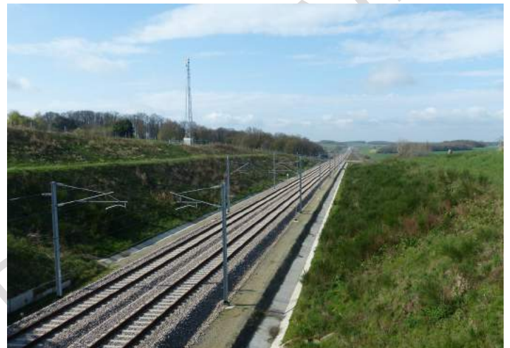
Figure 4 : fragmentation des boisements par l'agriculture Figure 5 : Fragmentation par les infrastructures de transport

Par ailleurs, dans les petites populations, les processus écologiques sont moins intenses, comme le montre l'exemple de la figure 6. La production de graines par fruit chez la primevère ( Primula elatior ) dans des fragments forestiers varie de 10 à 70 selon la taille de la population.