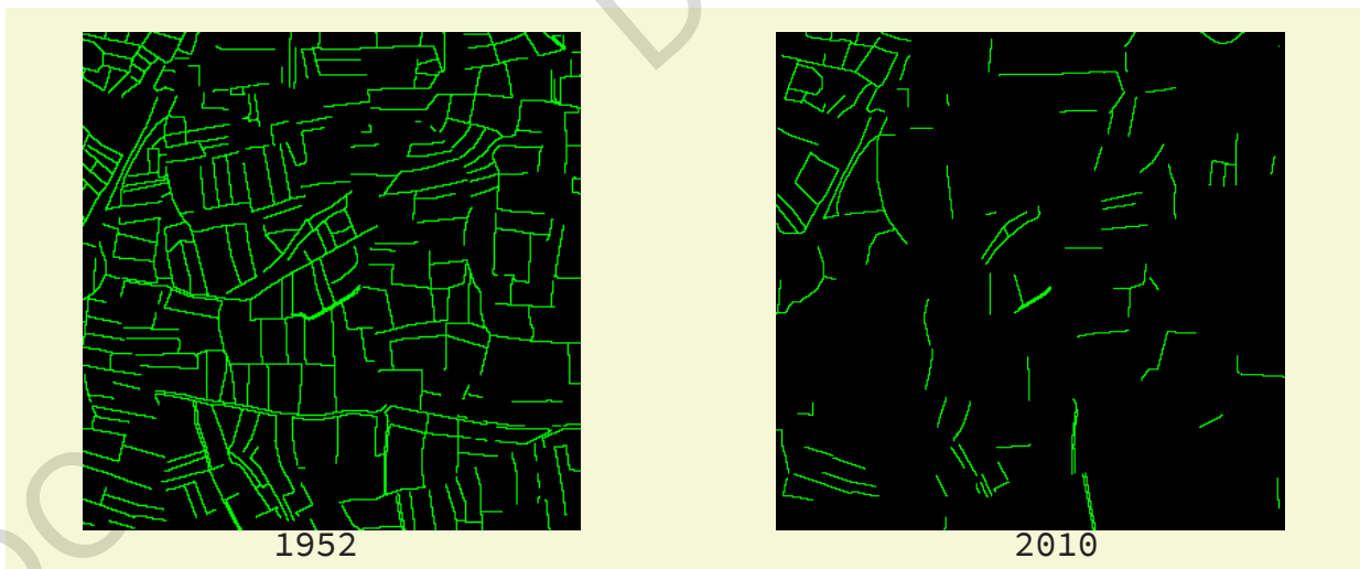
Figure 1 : la fragmentation d'un réseau bocager (Nord de l'Ille-et-Vilaine) observée par des images satellites. Les haies sont représentées par les linéaires verts.

C'est le fait qu'un habitat d'une grande surface continue a été, en grande partie, détruit par les activités humaines. Elle se caractérise par la réduction et le découpage d'un habitat en plusieurs taches plus ou moins isolées les unes des autres. Il ne reste alors que des îlots épars. Il y a simultanément perte d'habitat et isolement des îlots restants. Un habitat est dit fragmenté quand il passe d'une taille suffisante à une taille trop petite, soit par réduction progressive de sa surface, soit parce qu'il est coupé en fragments du fait de l'évolution de l'utilisation des terres (figure 1).